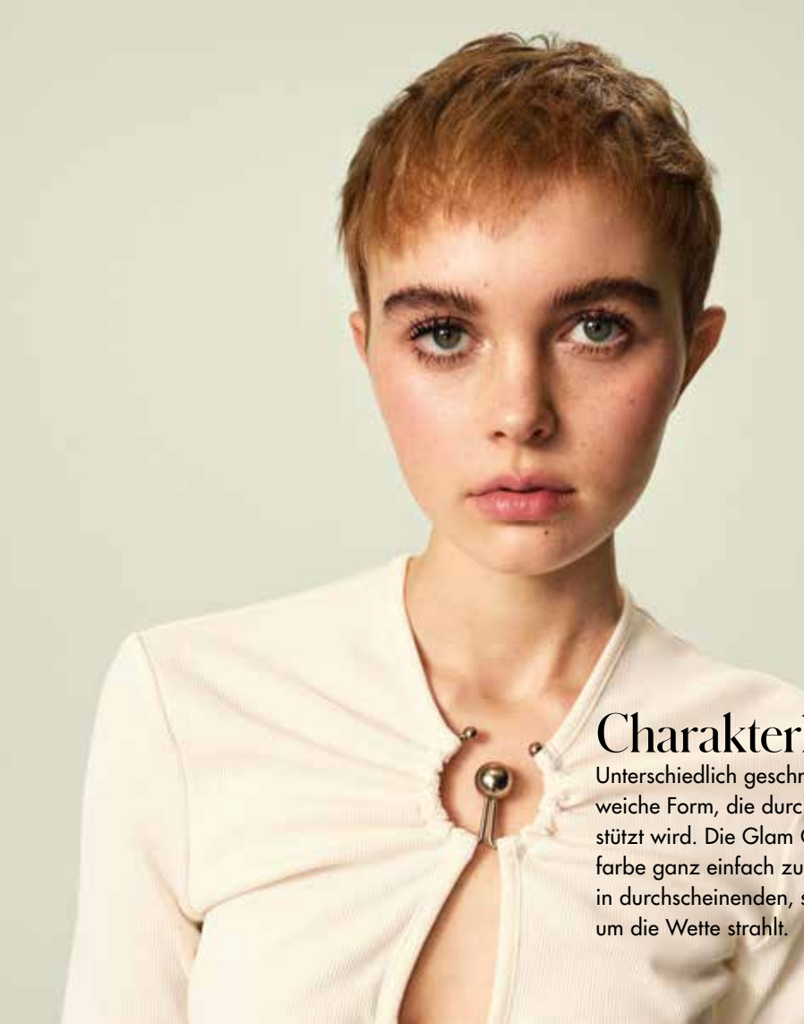
Cream Gloss Pinky Nude