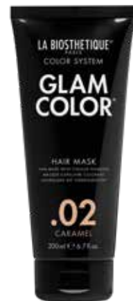
HOME CARE: Glam Color Hair Mask .02 Caramel