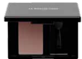
Magic Shadow 51 Pale Mauve

Magic Shadow 51 Pale Mauve umspielt den Blick und unterstreicht die souveräne, in sich ruhende Präsenz des Looks.