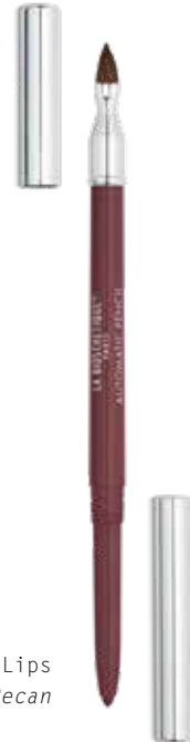
Automatic Pencil for Lips LL38 Pecan